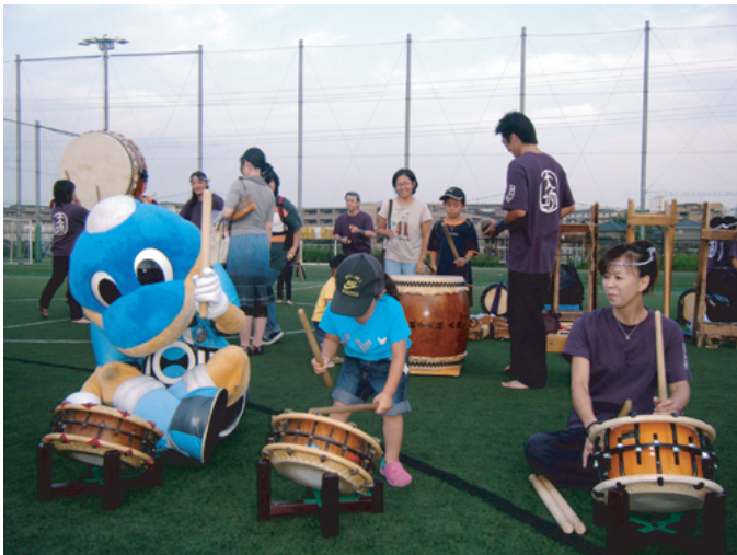
野川親子太鼓『大地』による体験会もあります。 この機会に太鼓デビューしてみませんか？