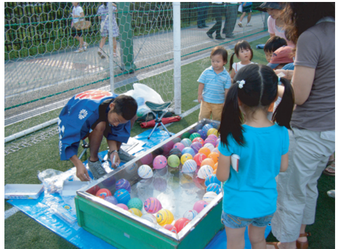
夏祭りには欠かせない、大人でもワクワクしちゃう縁日の屋台。みんなで楽しもう！