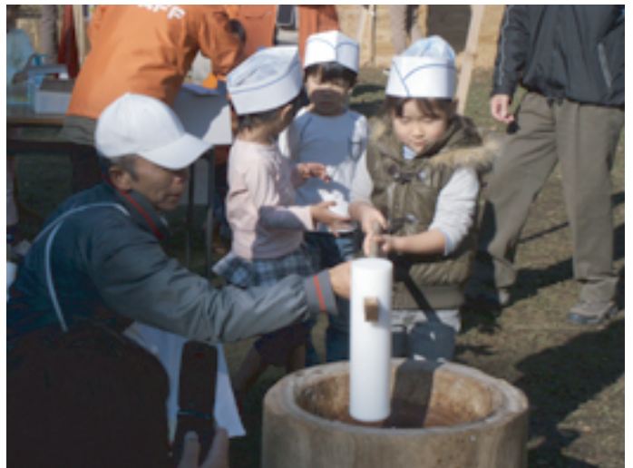
餅つきが体験できるよ。