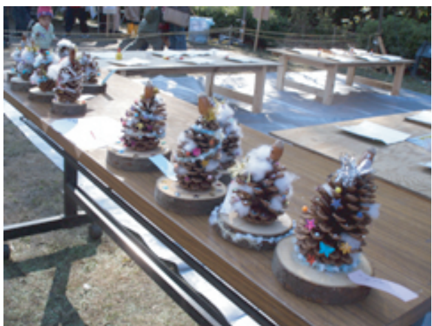
工作コーナー、楽しいよ！