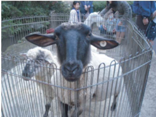
今年はどんな動物が来るかな。

今年も恒例の感謝祭のシーズンとなりました。楽しいイベントがたくさん待っています。実りの秋、収穫に感謝し、楽しい1日を過ごしましょう！