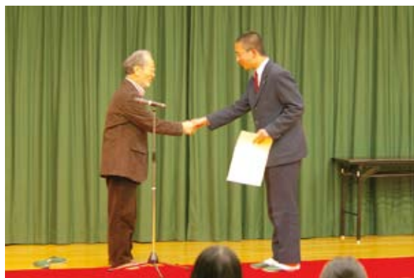
千葉審査委員長と握手を交わす

中学生は、夏にプロの映画監督から撮影のいろはを学んだ後、自分たちで撮影した映像の編集講座なども受講し、オリジナルの作品づくりにとりかかりました。「中学生、宮前を知る」をテーマに、中学生ならではの独創的な視点で宮前区を切り取った作品に仕上がっています。今年は、初参加の中学生、中でも1年生の作品が目立ちます。