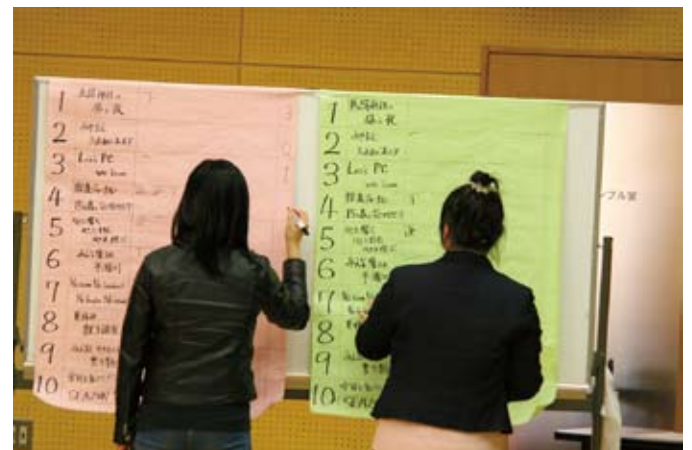
会場のみなさんによる特別賞の投票