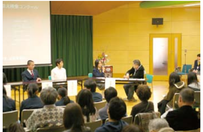
プロの映画監督を交えた座談会