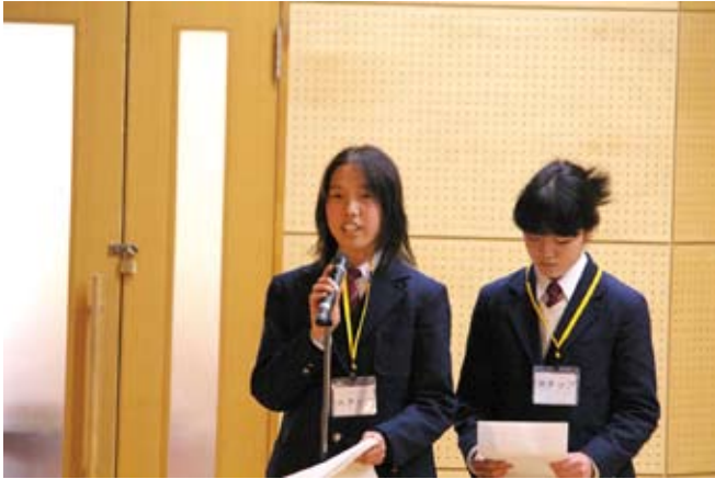
司会進行も中学生が担当します

審査員選考の他に、当日の来場者が選ぶ特別賞もありますので、見るだけではなく、審査にもぜひご参加ください。