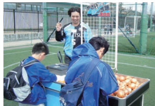
大好評の野菜詰め放題！