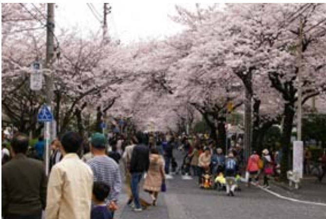
毎年たくさんの人でにぎわうさくら坂

日時：2011年4月3日（日）10：00～16：30 場所：宮崎台駅前広場、さくら坂 ほか