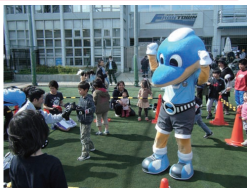
今年もふろん太くん大活躍！？

今年も「はるまつり」を開催します。 フットサルミニゲームやキックターゲットなどのアトラクションに加えて、前回に続きフリーマーケットも同時開催。さらに今回は昨年も大好評だったキッズダンスショーだけではなく、ダンス体験企画も実施します。 ※入場は無料です。