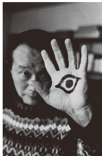
1963年 美術出版社