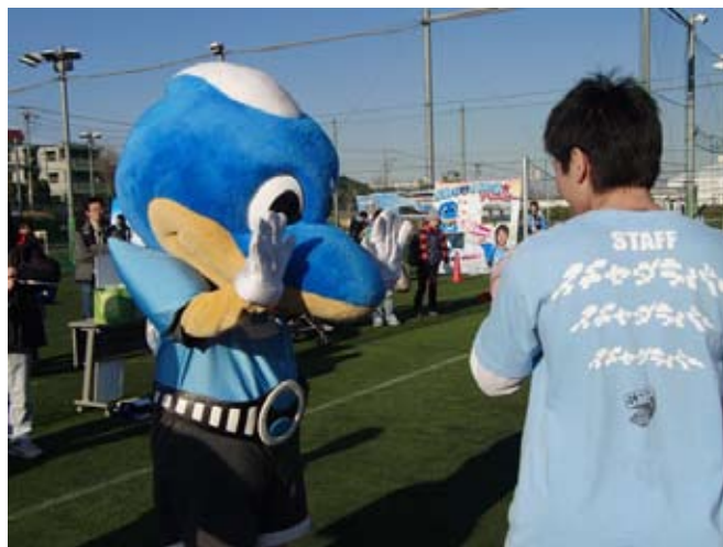
ふろん太くんもやってくる!

かわさき舞祭 キッズダンス&体験 (15:00～16:00予定) 無料 かわさき舞祭によるキッズダンス披露他、無料体験ができます。